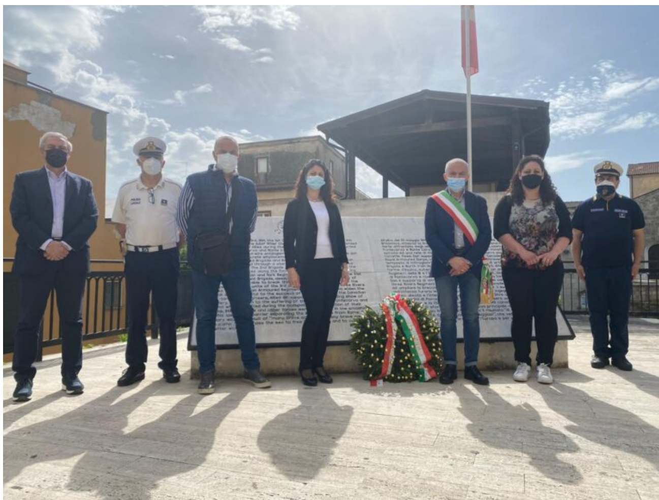
Posa della corona di fiori